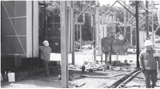
La labor continúa en la Subestación 68.

MLGW ha finalizado la restauración parcial de la Subestación 68. La restauración total deberá completarse para finales de febrero de 2017.