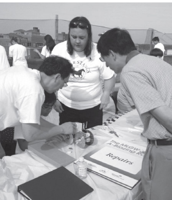
Voluntarios efectúan reparaciones a un vehículo de modelo solar durante la competencia A-Blazing Race.

MLGW ha completado exitosamente su segunda Carrera A-Blazing, una competencia de vehículos de modelo solar para niños y niñas exploradores en los grados escolares de tercero a octavo. La carrera se llevó a cabo el sábado 16 de agosto en la terraza del edificio de estacionamientos Beale Street Landing de MLGW.