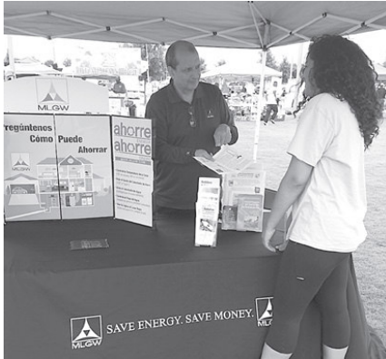
En la foto, un representante bilingüe de MLGW explica a una cliente cómo ahorrar energía durante las vacaciones.

MLGW continúa su apoyo a la comunidad latina mediante la constante participación en eventos especiales dirigidos a este segmento de nuestra comunidad. MLGW está siempre presente en tales eventos con información sobre cómo ahorrar energía para una factura mensual más baja, cómo permanecer seguro alrededor de los servicios públicos, y cómo evitar convertirse en víctima del fraude. Esta vez fue durante el Festival Latino, el cual celebró el vigésimo aniversario de la emisora local Radio Ambiente.